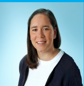
Belegärztin, Klinik Bad Bergzabern, S. Zur