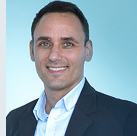
Leiter Pflegeschule, J. Kreikenbaum