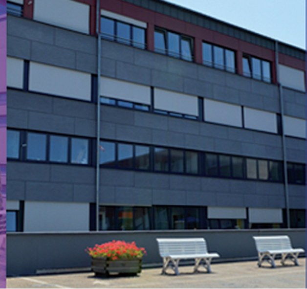
Klinik Bad Bergzabern